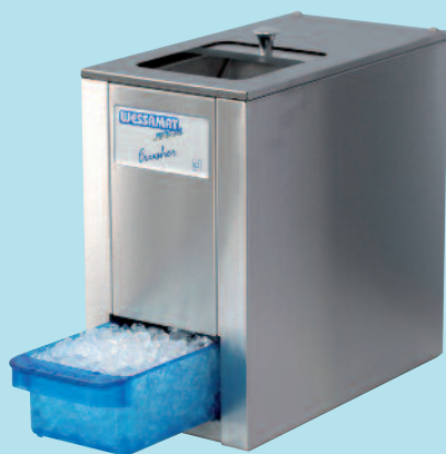
Eiscrusher C 103 im klassischen Gastronomie-design mit Gehäuse aus Edelstahl und Auffangschale aus lebensmittelgeeigneten Kunststoff

Die elektronischen Eiscrusher von WESSAMAT sind einfach zu bedienen und benötigen nur ganz wenig Platz. Die Modelle C 103 und CB 103 sind aufgrund ihres Designs und ihrer Größe bei Barkeepern und Gastronomen besonders beliebt. Der Crusher wird einfach von oben mit Eiswürfeln befüllt. Das Crushed-Ice sammelt sich in der Auffangschale und kann sofort verwendet werden – einfacher und frischer geht es nicht.