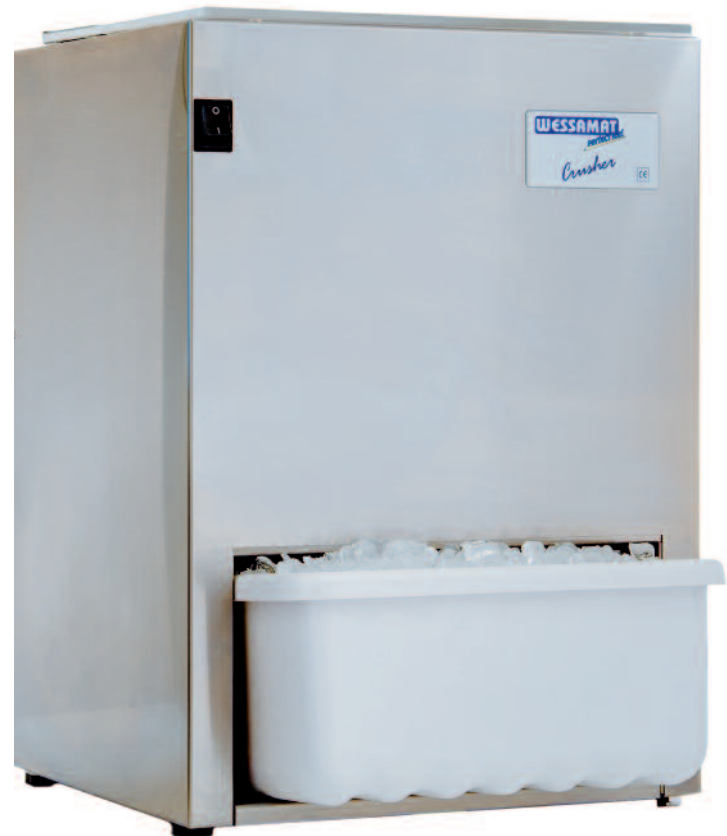
Eiscrusher Modell C 105 mit Gehäuse aus Edelstahl und Auffangschale aus lebensmittelgeeignetem Kunststoff

Wenn für die Zubereitung von Cocktails und Drinks sowie für die Präsentation von Speisen und Getränken größere Mengen an Crushed-Ice benötigt werden, ist der Eiscrusher C 105 genau das richtige Gerät. Er besitzt ein leistungsstärkeres Mahlwerk mit größerem Eiswürfelschacht und eine Auffangschale mit einem Volumen von 5 kg. Sie kann aus dem Crushergehäuse entnommen werden, um das Crushed-Ice dort hin zu transportieren, wo es benötigt wird. Trotz der höheren Leistung ist auch dieses Modell erstaunlich kompakt und kann im Bar- und Thekenbereich, in einem Nebenraum oder auch in der Küche platzsparend und gastronomiegerecht platziert werden.