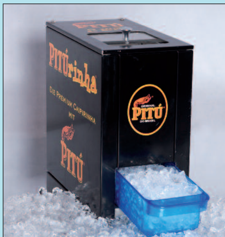
Eiscrusher C 103 mit individuellem Branding

Die Eiscrusher C 103 und CB 103 sind praktische und beliebte Helfer in der Gastronomie. Deshalb werden sie von Spirituosen-Herstellern und bekannten Getränkemarken für Promotion- und Verkaufsförderungsaktionen erfolgreich eingesetzt. Für ein unverwechselbares Corporate Design können die Gehäuse individuell gestaltet und im markengerechten Branding geliefert werden.