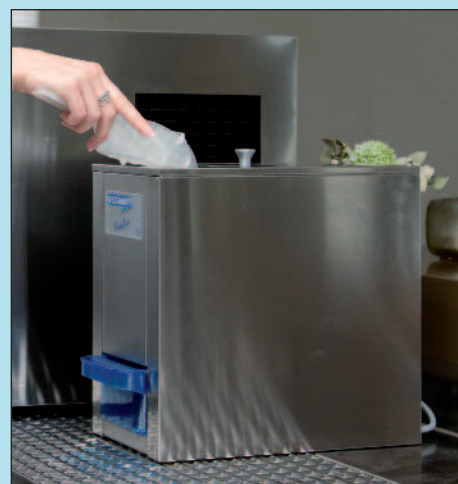
Eiscrusher C 103 in Kombination mit einem WESSAMAT-Eiswürfelbereiter, Modell Top-Line W 21 L (Table-Top-Version, luftgekühlt)

Die Eiscrusher von WESSAMAT machen aus Eiswürfeln in Sekundenschnelle erstklassiges Crushed-Ice. Hierfür können Eiswürfel aller Eisbereitungsmaschinen verwendet werden. Besonders praktisch und platzsparend ist die Kombination mit den voll einbaufähigen oder freistehend platzierten WESSAMAT Eiswürfelbereitern der Produktlinien Blue-Line und Top-Line.