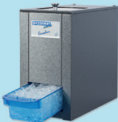
Eiscrusher CB 103 mit exklusivem Gehäuse aus geprägtem Edelstahl (Farbe anthrazit) und Auffangschale aus lebensmittelgeeigneten Kunststoff

Für die Zubereitung von coolen Drinks und exotischen Cocktails sowie für die Präsentation von Speisen und Getränken ist Crushed-Ice in der Bar und in vielen anderen Bereichen der Gastronomie unverzichtbar. Fantasiervolle Drinks und köstlich kühle Mixgetränke werden mit Crushed-Ice zu einem besonderen Erlebnis. Auch Säfte, Milchprodukte, Feinkostsalate und Meeresfrüchte sind auf Crushed-Ice serviert ein besonderer Genuss.